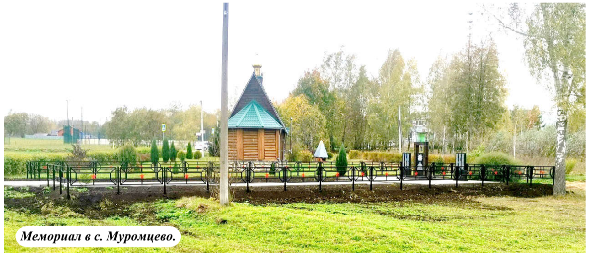
Мемориал в с. Муромцево.

кладбища, особенно расположенные в удалении от «центральной усадьбы», как раньше говорили, поселения, зарастают деревьями, рушатся их ограды.