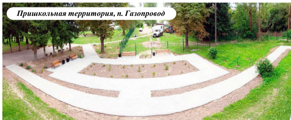
Пришкольная территория, п. Газопровод